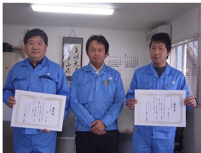
社長(中央)から表彰された両社員

また、派遣元が派遣労働者と正社員もしくは無期雇用の契約をしている場合はその限りではなく、派遣契約の終了と同時に解雇等は出来ないという規定が加わります。