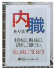
本社フェンスに掲げている看板です