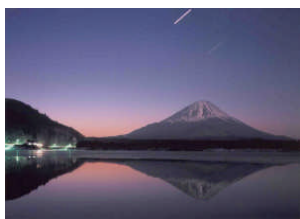
美しい逆さ富士が映る河口湖

本栖湖、精進湖、西湖、河口湖、山中湖の総称です。いずれも過去の富士山の噴火で流れ出た溶岩を川がせき止めたことで形成されました。春には河口湖の北岸から見える逆さ富士と満開の桜が絶景です。それぞれが個性的な富士五湖は二〇一一年に、国の名勝に指定されました。